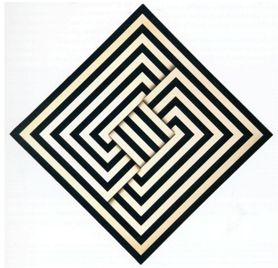
Omar Rayo (Colombia) Tama 1970

Durante los últimos diez años el Museo de Arte Latino Americano, MOLAA se ha dedicado no solo ha mostrar arte sino también ha educar al público norte americano sobre la cultura contemporánea de América Latina. Con esta exposición MoLAA lo invita ha profundizar en el conocimiento de la identidad latino americana y celebrar su diversidad.